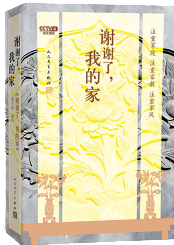
■《谢谢了,我的家》封面

现场专家总结,中华民族自古有“家国天下”的文化自觉,家庭的前途命运同国家和民族的前途命运紧密相